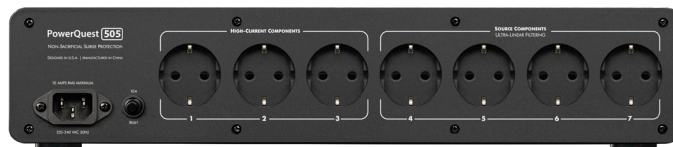
PQ-303 / PQ-505